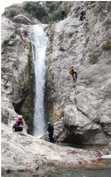
Gole Ranciara, giugno 2022