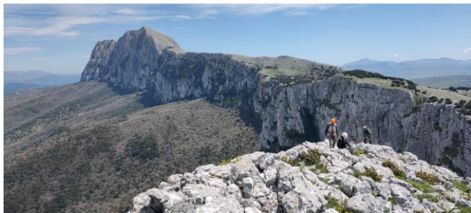
Rocca Busambra, aprile 2022