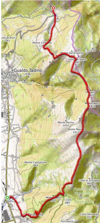
1° Tappa – 19 novembre 2022

Dalla località di Gaifana (480 m) si procede in direzione del paesino di Colle, da dove si inizia a salire fino ad incontrare, dopo circa 5 km, il Sentiero Italia all'altezza del Trivio di Luticchio (860 m). Si continua a salire passando sotto la cima di Monte Nero e, aggirando la cima del Monte Serrasanta, per arrivare all'omonimo eremo (1340 m). Si prosegue in discesa fino in località Valsorda dove si trova il rifugio di Monte Maggio (1004 m).