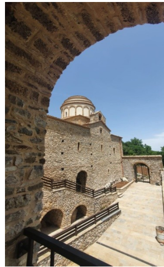
Abbazia di Sant'Angelo al Raparo