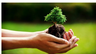
Rispetta la bellezza della natura

Per tutto quanto non specificamente indicato nel presente programma si fa riferimento al Regolamento delle Escursioni della Sezione CAI di Potenza che i partecipanti, iscrivendosi all'attività, confermano di conoscere e di accettare.