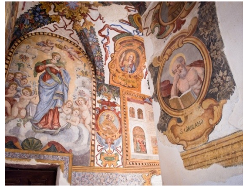
Convento "Fratelli Minori Osservanti"