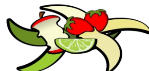
Non abbandonare rifiuti