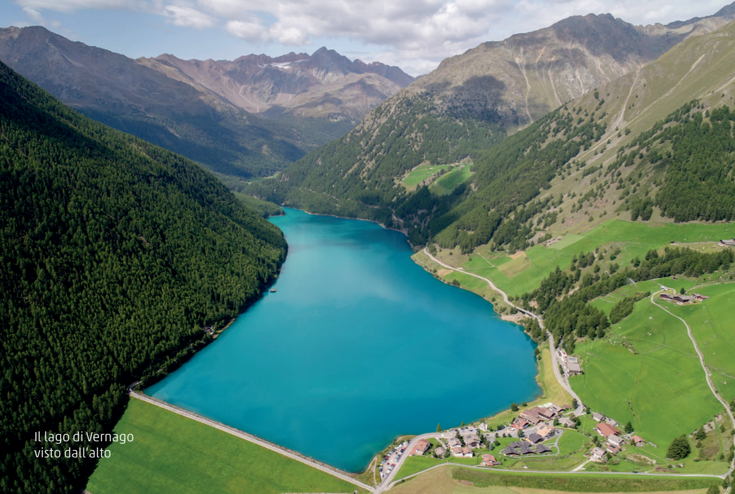
Il lago di Vernago visto dall'alto