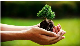
Rispetta la bellezza della natura