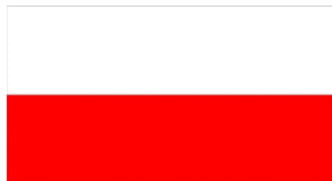
Segui il sentiero