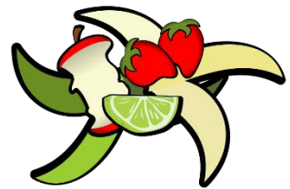
Non abbandonare rifiuti