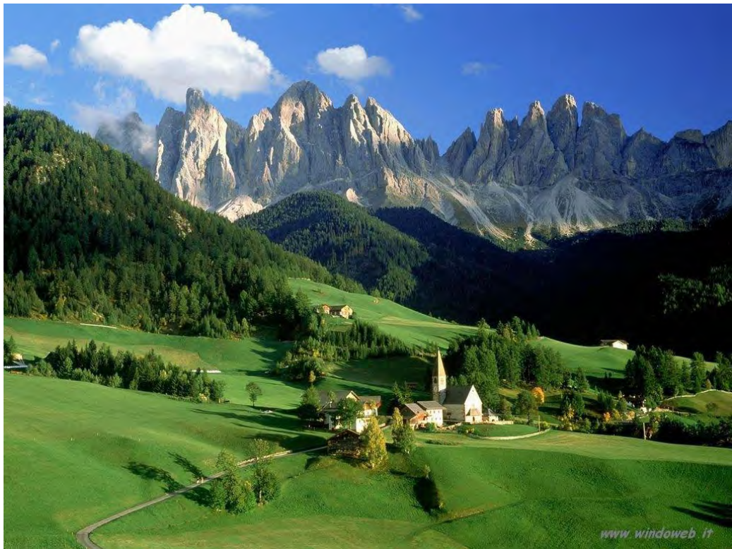
Funes e le Odle

Secondo la moderna accezione i beni ambientali fanno parte del patrimonio culturale di un paese, sono riconosciuti come zone corografiche, ossia rappresentative di una determinata regione, che costituiscono paesaggi naturali o trasformati ad opera dell'uomo (quelle zone in cui siano presenti strutture insediative urbane che, per il loro pregio, offrono testimonianza di civiltà). Ma non è sempre stato così. Nella legge 1° giugno 1939, n.1089 (Legge "Bottai"), a lungo restata il testo di riferimento per la tutela e la protezione dei beni culturali in Italia, si parlava infatti di "cose d'arte", comprendendo quindi solo beni significativi dal punto di vista estetico e solo beni costituiti da oggetti materiali. Parallelamente, nella legge n.1497 dello stesso anno, che riguardava la tutela ambientale, si parlava di "bellezze naturali", non elette ancora quindi a status di bene (o patrimonio). Secondo l'articolo 9 della Costituzione italiana, "la Repubblica promuove lo sviluppo della cultura e della ricerca scientifica e tecnica. Tutela e valorizza il patrimonio storico e artistico della nazione" . Solo nell'articolo 117, nelle competenze dello Stato e delle Regioni in materia di tutela e legislazione dei "beni culturali" , si afferma che è lo Stato che deve legiferare in tema di "tutela dell'ambiente, dell'ecosistema e dei beni culturali" .