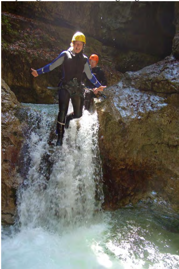
Canyoning, Daxa Bach, Kaisergebirge