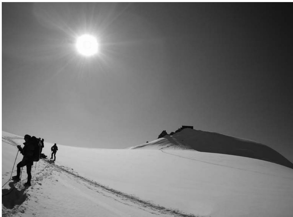
Monte Rosa - Punta Gniffetti, Capanna Regina Margherita (4554 m)