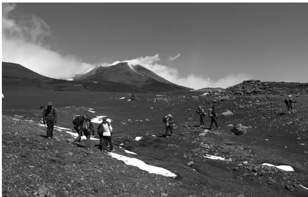
Etna, versante Sud - Piano del Lago zona Cisternazza

Occorre allora che il potere disciplinare sia esercitato a livello sezionale dal Consiglio Direttivo, a livello regionale dal Consiglio Direttivo Regionale, a livello nazionale dal Comitato Direttivo Centrale con le modalità previste dal regolamento disciplinare.