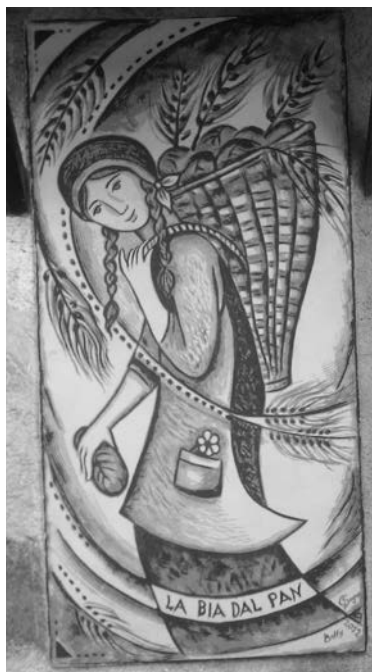
Cibiana di Cadore, murales