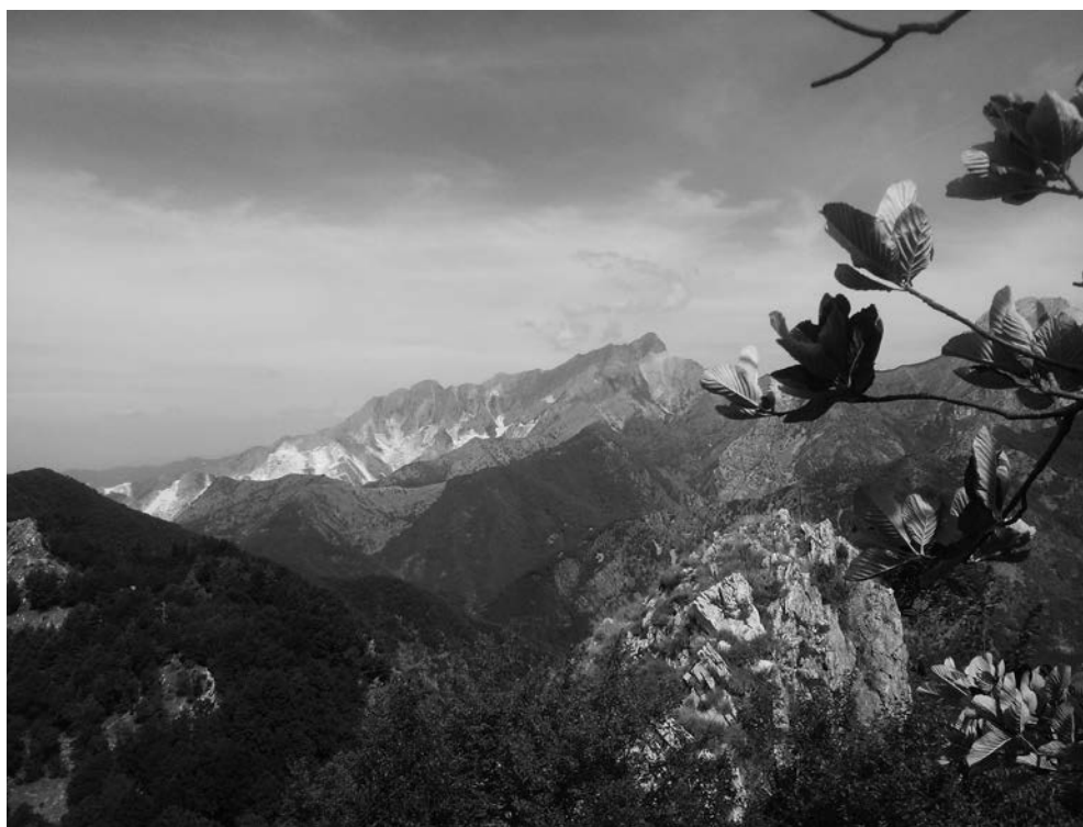
Apuane - Monte Sagro e bacino marmifero di Colonnata (dall'orto botanico Pietro Pellegrino)

Presidente Commissione Centrale Tam del CAI