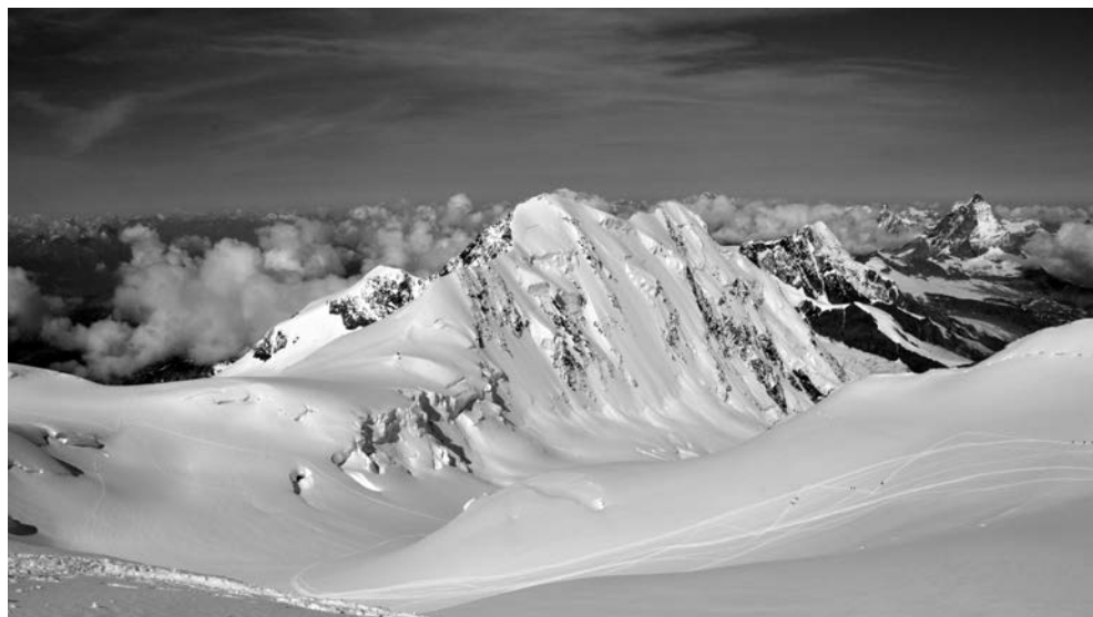
Lyscamm e Cervino (dal Colle del Lys, Monte Rosa)

Quaderno TAM n. 7 - Problemi energetici ed ambiente - del 2014