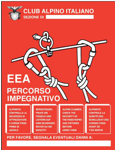
Tabella per via ferrata:

Va posta all'inizio di un sentiero di accesso ad una via ferrata o ad un sentiero attrezzato impegnativo nonché all'inizio del tratto attrezzato per l'invito – quadrilingue - ad usare correttamente le attrezzature fisse e ad autoassicurarsi alle stesse. Usualmente, sulla stessa tabella, viene indicato un recapito al quale segnalare eventuali danni alle attrezzature.