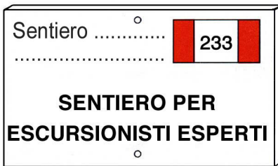
Tabella "Sentiero per escursionisti esperti"

E' in metallo e di colore rosso con scritte in bianco (misura 25 x 33 cm).