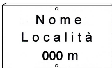
Tabella località La troviamo agli incroci più significativi di un percorso (passi, forcelle, piccoli centri abitati) che trovino riscontro sulla cartografia; è utile indicare il nome della località dove ci si trova e la relativa quota (non aggiungere punti per l'abbreviazione di metri o altro).

Misura 25 x 15 cm e sarà dello stesso materiale delle tabelle segnavia.