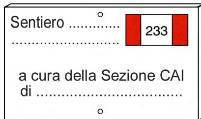
Tabella di adozione sentiero

E' di colore bianco - oppure tinta legno - con scritte nere. (misura 25 x 15 cm).