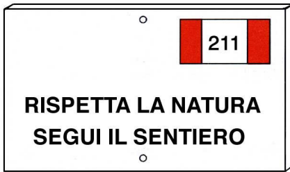
Tabella "Rispetta la natura segui il sentiero"

E' posta in prossimità di scorciatoie per invitare gli escursionisti a non uscire dalla sede del sentiero onde evitare danni al sentiero stesso e al suolo del versante.