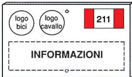
Tabella d'itinerario per bici e/o cavalli

E' di colore bianco - oppure tinta legno - con scritte nere. E' possibile l'inserimento di un logo del percorso. (misura 25 x 15 cm).