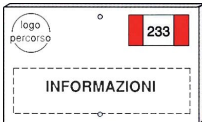
Tabella Sentiero tematico

E' di colore bianco - oppure tinta legno - con scritte nere. (misura 25 x 15 cm).